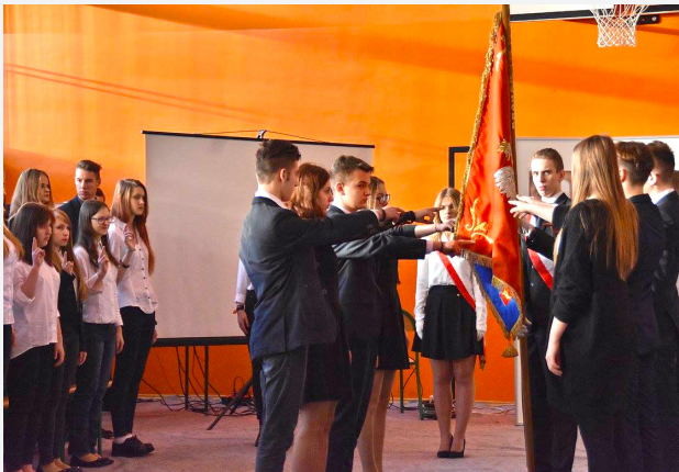
Ślubowanie klas pierwszych, 2016 r.

Tradycyjnie, po złożeniu przysięgi, uczniowie otrzymują pamiątkowe obwoluty zawierające tekst ślubowania, wykaz nauczycieli i uczniów rocznika rozpoczynającego Szkołę oraz tekst hymnu. Ślubowanie klas pierwszych ma nie tylko wymiar symboliczny, ale także integracyjny – pomaga nowym uczniom