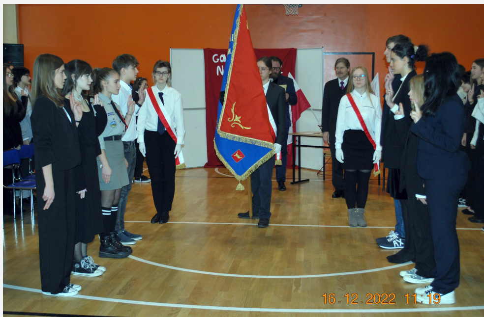
Ślubowanie klas pierwszych, 2002 r.