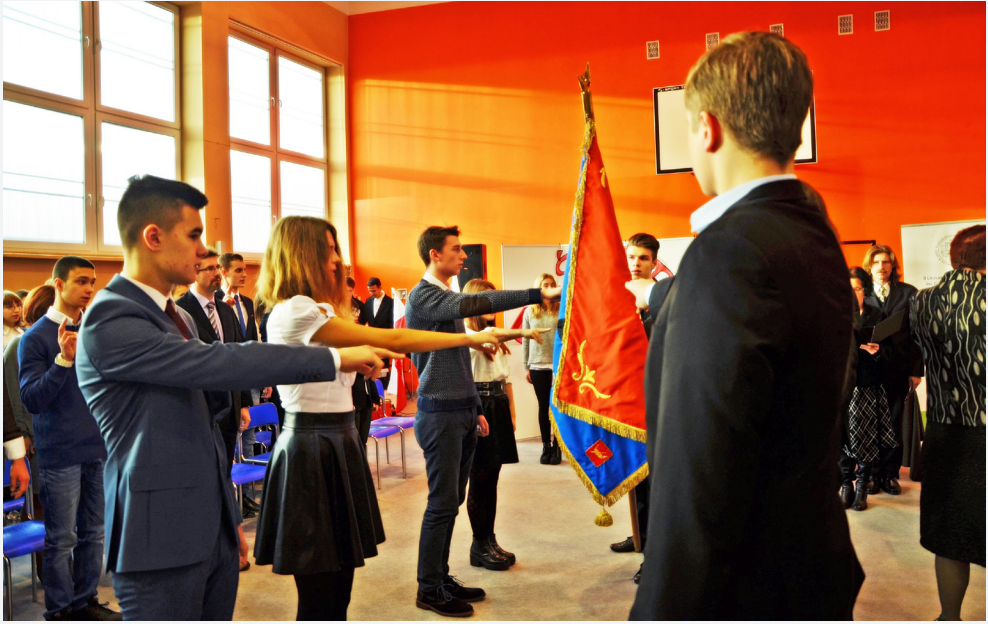
Ślubowanie klas pierwszych, 2014 r.

zdarzyło się, że niecała Szkoła mogła wziąć udział w tym wydarzeniu. Był to rok 2021 – czas pandemii.