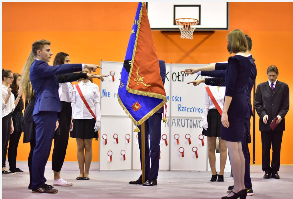
Ślubowanie klas pierwszych, 2017 r.